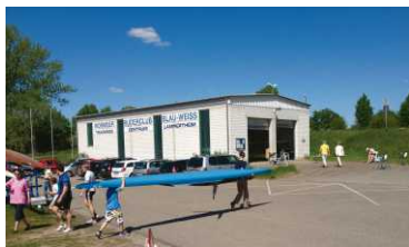
3. Walter Mauer Trainingszentrum

(Das Gelände befindet sich ufernah in der Mitte des Lampertheimer Altrheinarms am See.)