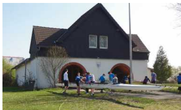
2. Halle am See